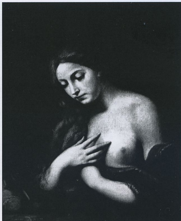
Fig. 5 - Maddalena - Italia mercato antiquariale

Le sue sante, martiri o non, in sofferenza o in estasi che siano, sono donne vive, senza odore di sacrestia, a volte perfino provocanti nel turgore delle forme e nell'espressione di attesa non solo di sposalizio mistico, «col bel girare degli occhi al cielo» (De Dominici) e con le splendide mani dalle dita affusolate a ricoprire i ridondanti seni.