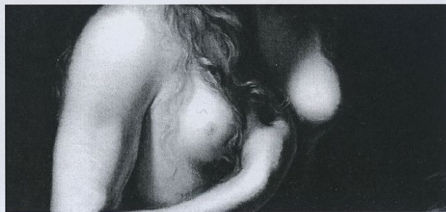
Fig. 3 - Andrea Vaccaro - Maddalena - 97 - 74 (particolare) Bruxelles collezione privata