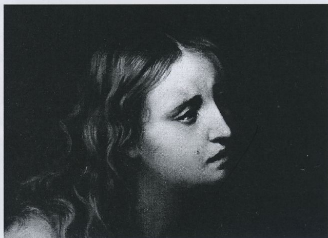
Fig. 2 - Andrea Vaccaro - Maddalena - 97 - 74 (particolare) Bruxelles collezione privata