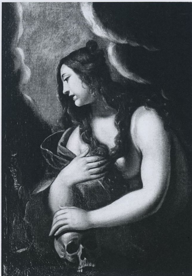
Fig. 6 - Maddalena - Italia mercato antiquariale

punta di erotismo, con i loro capelli d'oro luccicanti, con le morbide mani carnose e affusolate nelle dita, con le loro vesti blu scollate, tanto da mostrare le grazie di una spalla pallida, ma desiderabile. I volti velati da una sottile malinconia e con un caldo languore nei grandi occhi umidi e bruni, che aggiungono qualcosa di più acuto alla sensazione visiva delle carni plasmate con amore e compiacimento.